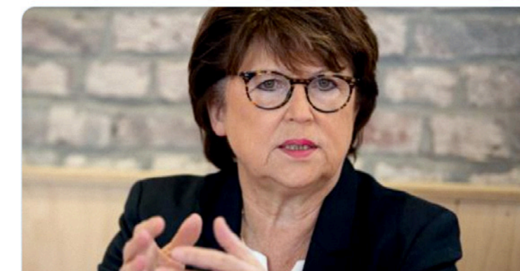
Municipales 2020 à Lille : Martine Aubry (PS) candidate à un quatrième mandat lavoixdunord.fr