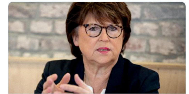
Municipales 2020 à Lille : Martine Aubry (PS) candidate à un quatrième mandat lavoixdunord.fr

À 69 ans @MartineAubry incapable de passer à autre chose. Terrible constat de voir ces élus accrocher à leur mandat. A quand une loi sur le non cumul dans le temps ?? #Municipales2020