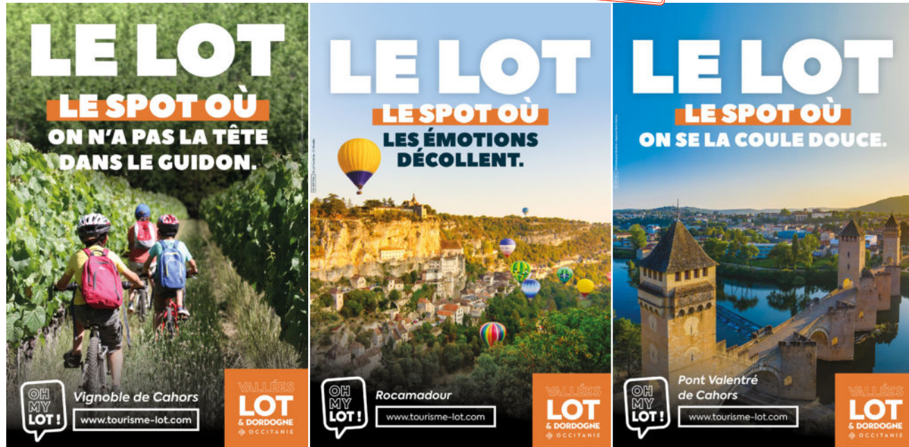
Campagne de communication Lot Tourisme, 2021.