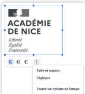
Gestion de la taille et de l'alignement sur Google Docs

👉 Découvrez un tutoriel pour LibreOffice/OpenOffice sur LLS.fr/SNT2FM3 .