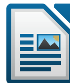
Writer par LibreOffice

👉 Visionnez un tutoriel de mise en forme de titres pour Writer sur LLS.fr/SNT2FM3 .