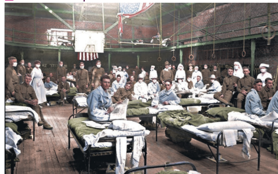
Soldats américains de retour du front européen, hospitalisés dans un gymnase de l'université du Kentucky, 1918, photographie (colorisée).