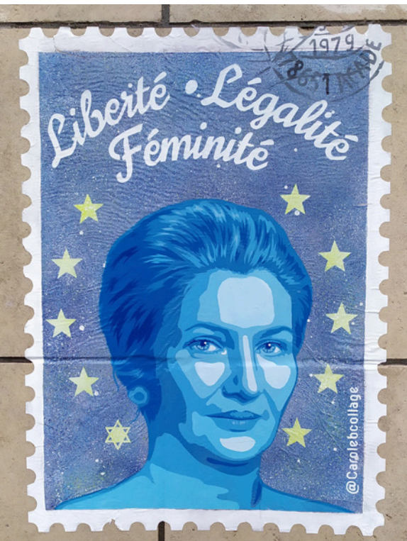
Doc 1 • Collage posté sur le compte Instagram @carolebcollage, 2020.

→ Coup de pouce • Juive, Simone Veil a été déportée à Auschwitz. En 1975, la loi Veil a autorisé l'avortement en France. En 1979, elle est devenue la première femme présidente du Parlement européen. En 2008, elle a été élue à l'Académie française.