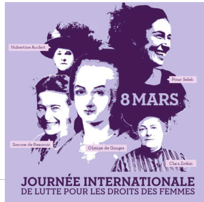
Doc 3 • Affiche de la ville de Strasbourg pour le 8 mars 2013.