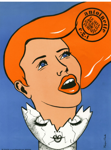
Doc 1 • Monique Wender, affiche pour Antoinette , « le seul journal syndical féminin », 1977.