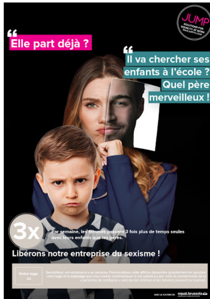
Doc 3 • Affiche d'une campagne de sensibilisation JUMP, 2019.

2. Doc 2 • En quoi cette affiche est-elle parodique ?