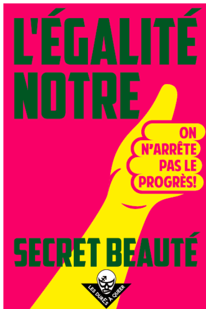
Doc 2 • Affiche du groupe féministe les DurEs à Queer, campagne pour le mariage pour tous, 2012-2013.

1. Doc 1 • Comment comprenez-vous cette image ? Quel(s) message(s) peut-elle porter ?