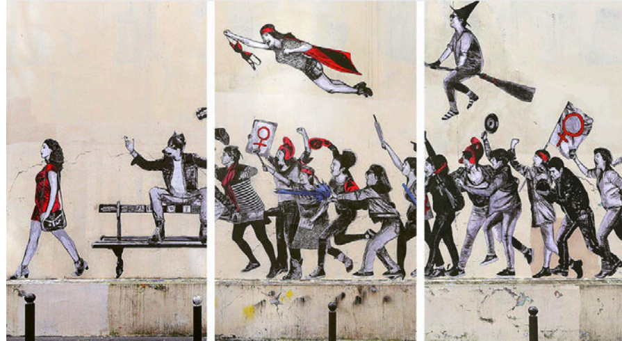
Doc 2 • Collage posté sur @jaeraymie, 8 mars 2018.

3. Doc 3 • En groupe, faites des recherches sur les femmes représentées et expliquez pourquoi elles ont été choisies.