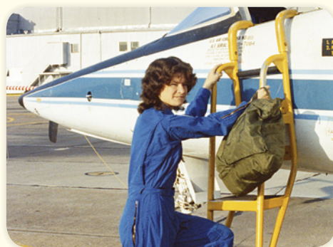
Sally Ride (1951-2012), astronaute et astrophysicienne américaine et auteure de livres de vulgarisation scientifique pour les enfants.