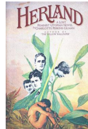
Couverture de l'édition américaine Knopf Doubleday, 1979.