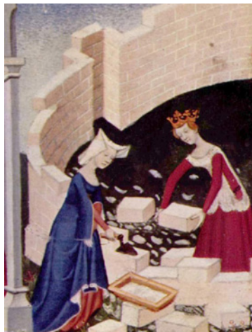
Miniature attribuée au Maître de la Cité des dames, XV e siècle, BnF.