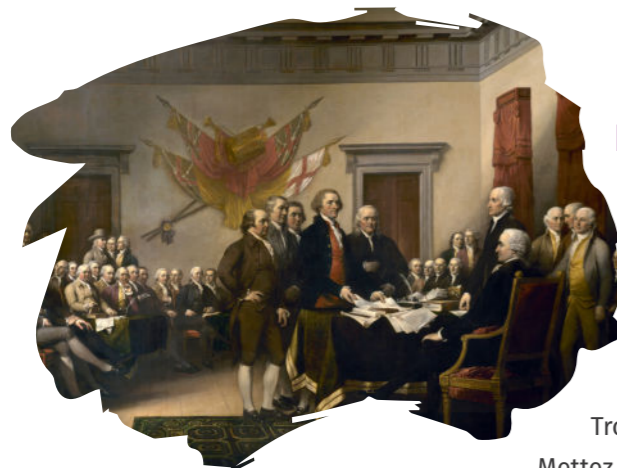
John Trumbull, La Signature de la Déclaration d'indépendance, 1825, huile sur toile, 3,7 x 5,5 m, Capitole, Washington.