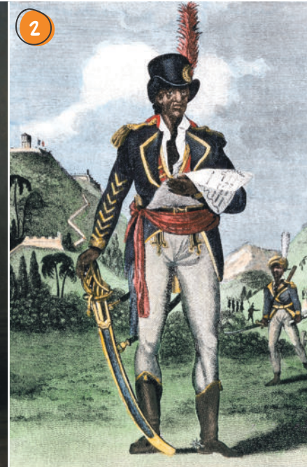
2 Des démocraties inachevées 1 Antoine-Jean Gros, Bonaparte, premier consul , 1802, huile sur toile, 205 × 127 cm, musée de la Légion d'honneur, Paris. 2 Portrait de Toussaint Louverture, 1803, gravure sur bois coloriée.

Les démocraties naissantes sont fragiles. En France, le général Napoléon Bonaparte fait un coup d'État (1799), prend le pouvoir et met fin à la République en se proclamant empereur (1804). À Saint-Domingue, Toussaint Louverture, héros de la guerre d'Indépendance, impose une constitution très autoritaire et conservatrice.