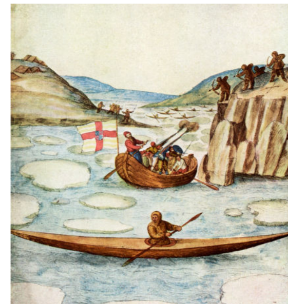
Escarmouche à Bloody Point, aquarelle d'après un dessin de John White, 1585-1593, British Museum, Londres.