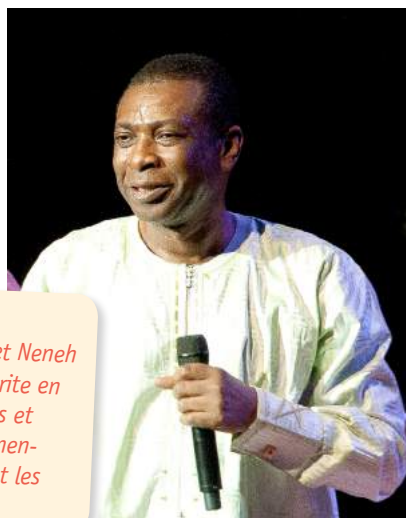
▲ Youssou N'Dour