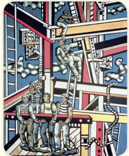
Les Constructeurs, Fernand Léger, 1950.