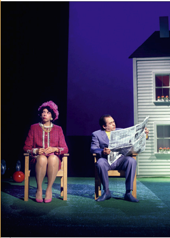
Doc. 1 Photo de la mise en scène de La Cantatrice chauve de Ionesco par Jean-Luc Lagarce, 1991.