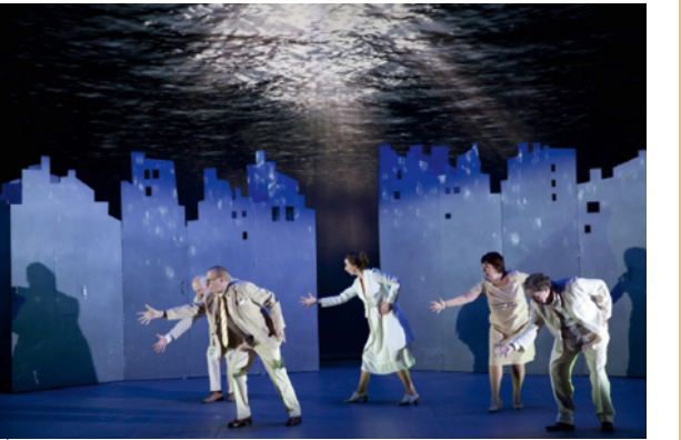
Doc. 3 Photo de la mise en scène de Jean-Michel Ribes, 2013.