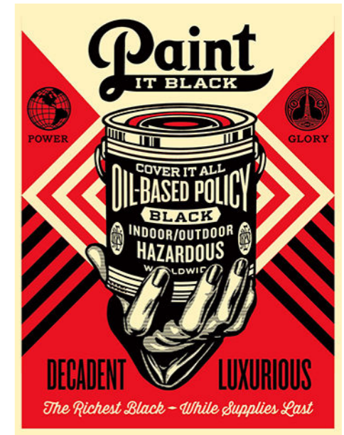
Shepard Fairey (OBEY) - Paint It Black - Hand, 2014.

De son vrai nom Shepard Fairey, OBEY est né en 1970. C'est un artiste états-unien connu pour ses sérigraphies, ses illustrations, ses fresques murales et la marque de vêtement qui en découle. Ce street-artist s'est fait mondialement connaître grâce à l'affiche « HOPE » pour la campagne présidentielle de Barack Obama en 2008.