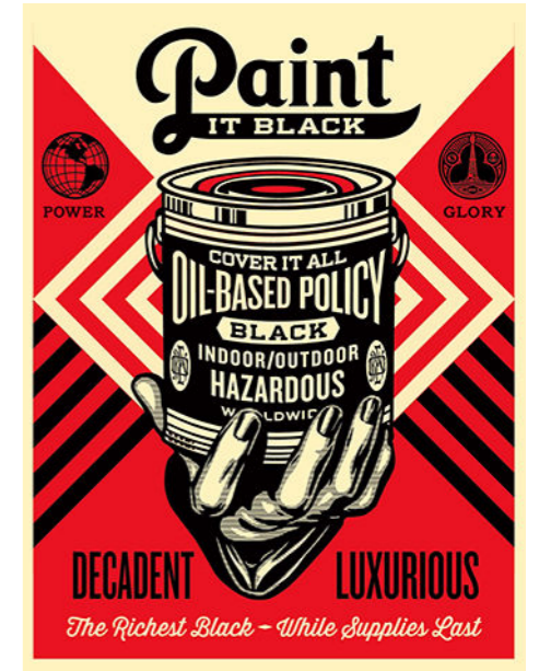
Shepard Fairey (OBEY) - Paint It Black - Hand, 2014.

De son vrai nom Shepard Fairey, OBEY est né en 1970. C'est un artiste états-unien connu pour ses sérigraphies, ses illustrations, ses fresques murales et la marque de vêtement qui en découle. Ce street-artist s'est fait mondialement connaître grâce à l'affiche « HOPE » pour la campagne présidentielle de Barack Obama en 2008.