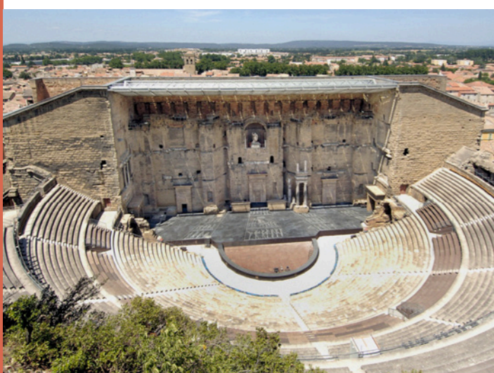
Doc. 3 Un exemple de théâtre romain antique : le théâtre d'Orange (France).