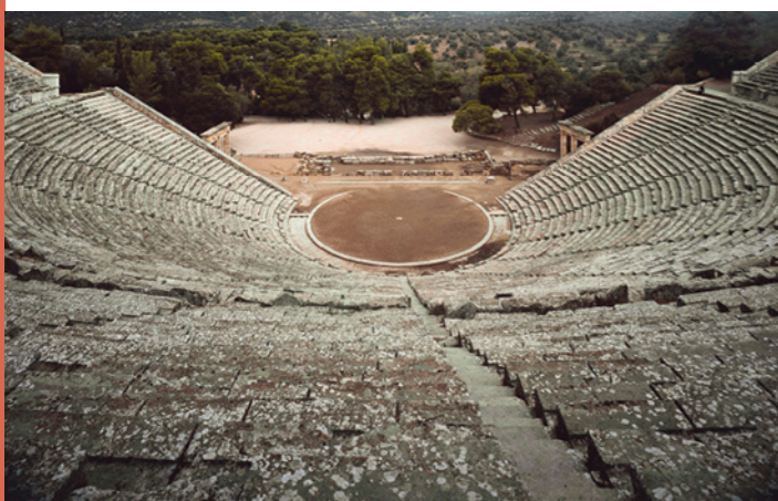
Doc. 2 Un exemple de théâtre grec antique : le théâtre d'Épidaure (Grèce).