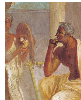
Doc. 5 Un acteur et un masque tragique, fresque de Pompéi, Musée archéologique national, Naples.

Aristote, La Poétique , 335 av. J.-C., trad. du grec ancien de Charles-Émile Ruelle, 1883.